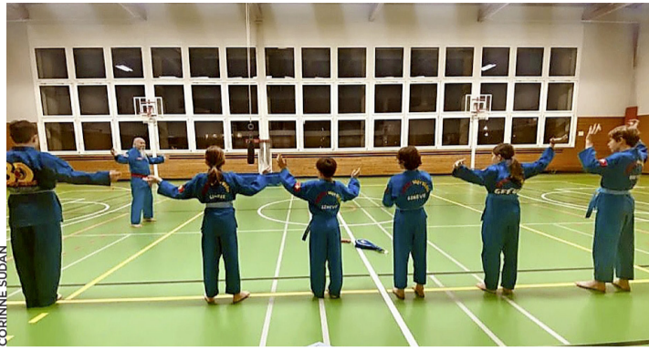
Cours de Vovinam Viet Vo Dao à la salle de gymnastique.

Cet art martial se distingue non seulement par sa profonde