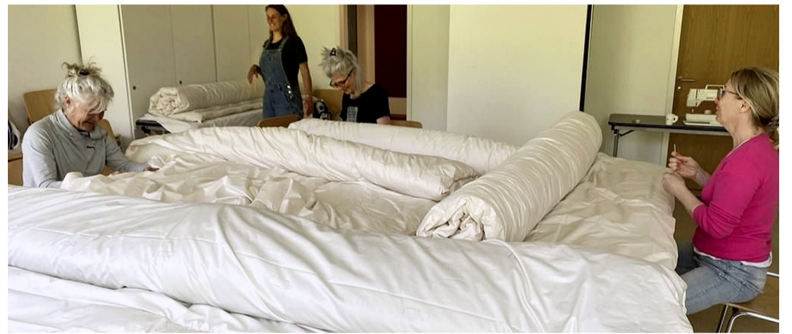
Un atelier de fabrication de duvet dans une classe de l'école d'Hermance.