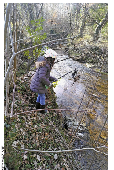
La pêche aux détritus.

En quelques heures, 260 kilos de détritus ont été apportés par