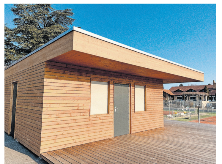
Tout de bois revêtu, voici le club-house. Patrick Jean Baptiste

Le club est installé au club-house, qui se situe près du nouveau groupe scolaire, depuis environ trois ans, et cet endroit demeure le lieu des rencontres des membres de l'association au moins pour les cinq prochaines années. Cette inauguration arrive également à point nommé, puisque le club est à sa 35 e année d'activités au sein de la commune. Ce sera donc un événement festif dans un but d'échanges avec la population.