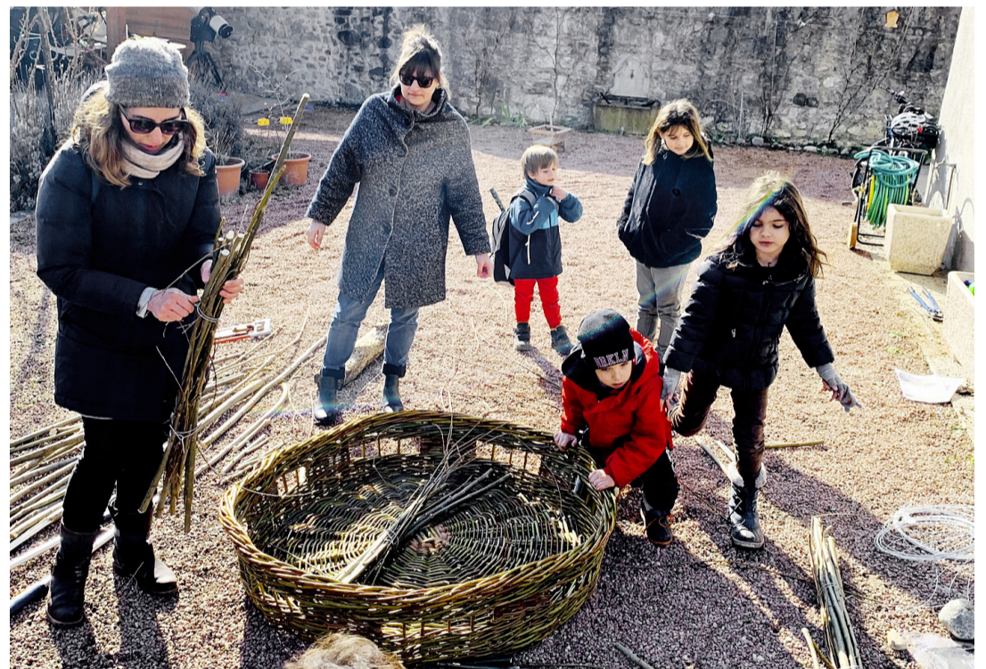
Parents et enfants participent à la confection du matelas, fait de branches de saule, qui pourra accueillir les cigogneaux.

Il ne nous reste plus qu'à croiser les doigts et à être patient, un regard jeté vers le ciel au passage du 32 de la route de Chevrier. Est-ce que les cigognes se laisseront tenter?