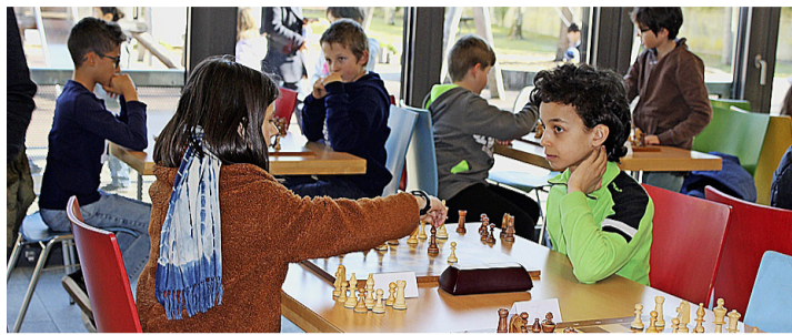
Les enfants se sont mesurés aux pions.