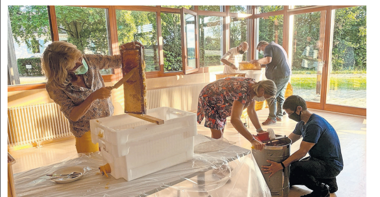
Les participants en plein travail de récolte. DOMINIQUE MORET

au 077 438 31 40 et sur www.printempsdabeilles.ch