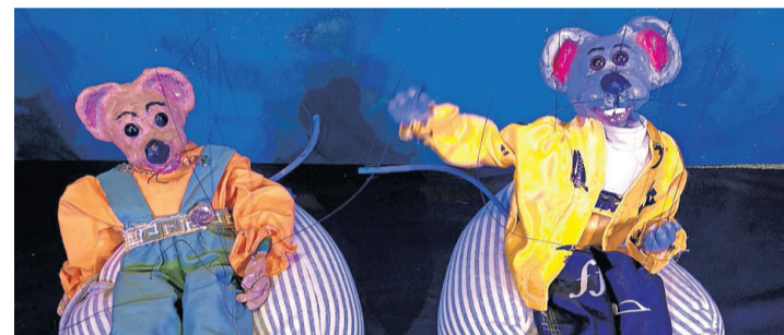
Les deux souriceaux sur scène. CIE FARFELUNE

Les enfants dès 4 ans sont invités à découvrir l'histoire de deux souriceaux, chassés de leur domicile respectif, qui se rencontrent dans un petit village en bordure de mer. Ils vont se lier d'amitié et partager tout ce qu'ils possèdent. Hé-