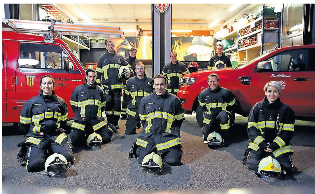
La Compagnie des sapeurs-pompiers d'Hermance dans leur caserne.

Excellente école de la vie, c'est une formation passionnante et