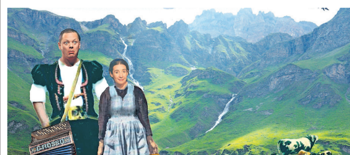
Il était une fois dans les Alpes... COMPAGNIE LA PIE QUI CHANTE