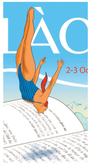
Détail de l'affiche.

forts de dédicaces. Au programme également: des tables rondes et un cycle de conférences par des écrivains, des historiens et des scientifiques, autour de «La mémoire», thème du festival de cette année. Des intermèdes musicaux et artistiques seront également au rendez-vous, en résonance avec la nature et le lieu de l'événement. Ce festival, gratuit et ouvert au public, a lieu à la ferme de Saint-Maurice à Collonge-Bellerive, selon les règles sanitaires actuellement en vigueur. Les organisateurs privilégient la mobilité douce pour se rendre à ce festival, mais il y aura tout de même un parking gratuit à disposition. Une restauration sur place est également prévue pour le public. Pour plus d'informations sur www.festival-du-lac.com . Patrick Jean Baptiste