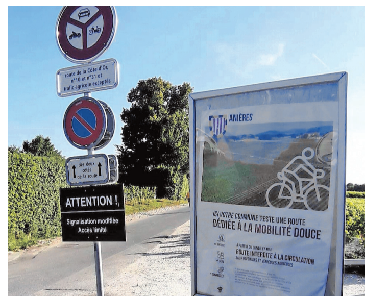
Panneau à l'entrée de la route de la Côte-d'Or. ANTOINE ZWYGART

La faune et la flore sont multiples et vous pourrez y observer à certaines heures, de préférence à l'aube où à la nuit tombante, de superbes lièvres argentés sautant dans les vignes, des poules faisanes, des grives, une multitude d'oiseaux. Croiser un renard, un blaireau et parfois, la nuit, une horde de sangliers allant s'abreuver dans le nant d'Aisy. De mi-mars à mi-août, vous serez accompagnés de magnifiques milans volant majestueusement au-dessus de