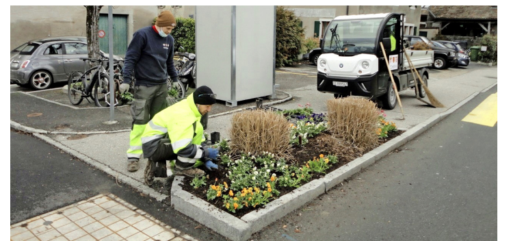
Les jardiniers en pleine plantation. DENISE BERNASCONI

Eh bien, avec l'arrivée du printemps et son lot d'incertitudes, c'est ce que nous avons décidé de faire. C'est ainsi qu'en arpentant les rues du village, nous avons surpris nos employés communaux en pleine plantation de fleurs d'agrément dans les bordures, bacs et jardinières de la commune, composés principalement de pensées. Des pensées à grosses fleurs et des pensées à pe-