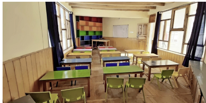
L'intérieur coloré d'une des nouvelles classes. APECH