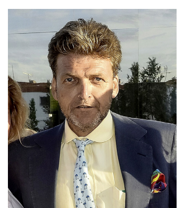
Benjamin de Rothschild.

Descendant de la dynastie Rothschild, le baron était connu pour son franc-parler mais aussi pour sa générosité, notamment à travers ses fondations pour l'en-