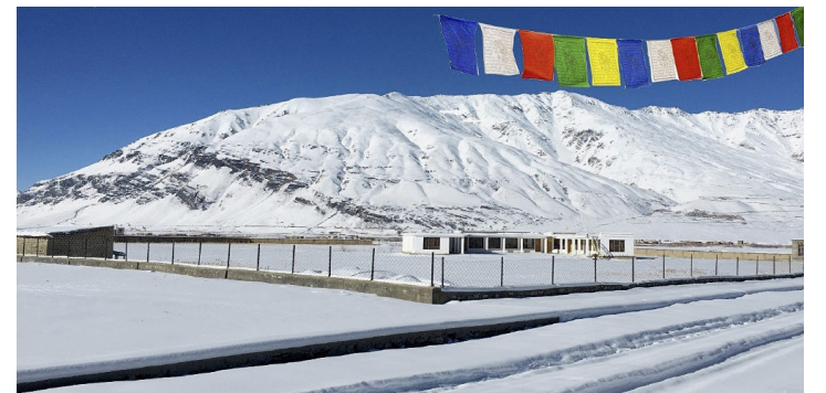
Vue de l'école et ses abords. TANTAR LUNDUP