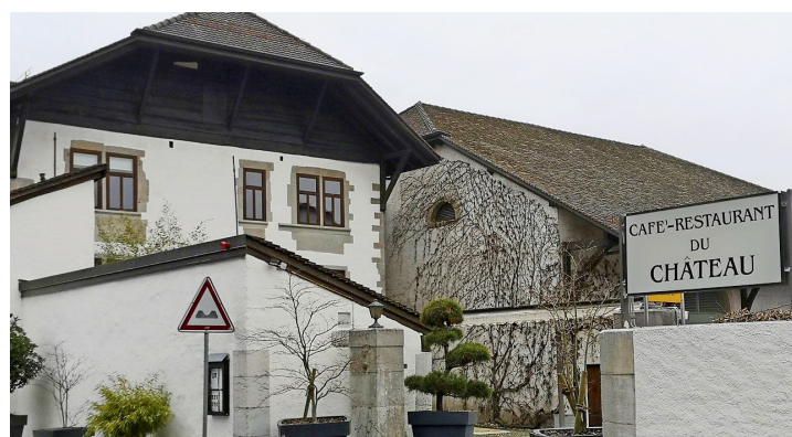
Le restaurant du Château à Genthod. TARA KERPELMAN PUIG

La Mairie - www.genthod.ch - recherche des jeunes domiciliés dans la commune et âgés de 16 ans révolus au 1 er juin 2021 pour ses services Voirie, Parcs et promenades, et Conciergerie. Les dossiers de candidature doivent être envoyés d'ici au 30 avril.