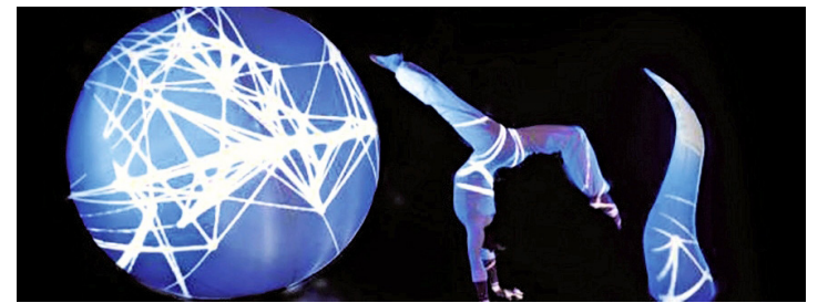
Synthesis. COMPAGNIE LUMEN CRÉATIONS