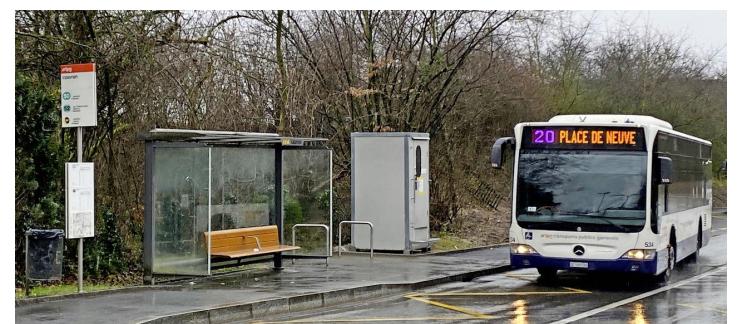
Le nouveau terminus TPG de Valavran. CAROLINE DELALOYE

Voilà qu'aujourd'hui, les connexions ville-campagne re-