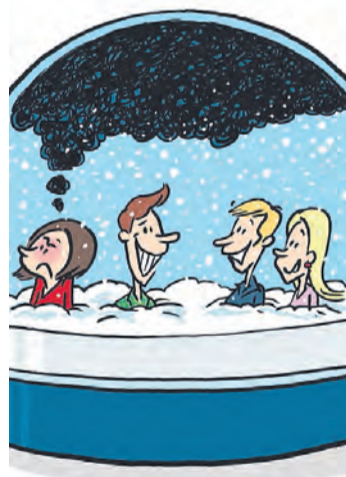
«Venise sous la neige».

Un humour accessible et rythmé par des dialogues incisifs qui font mouche dans une histoire moderne et enjouée. De quoi passer une ex-