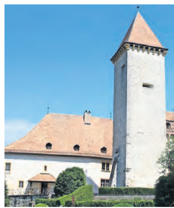
Château de La Sarraz.

Deux autocars ont transporté les Bellevistes jusqu'au château de La Sarraz, dans le canton de Vaud. Cet édifice, dont la première construction - un simple donjon - remonte à 1049, a appartenu pendant près de neuf siècles aux descendants d'une même famille, soit par mariage, soit par héritage, en particulier les de Grandson et les de Gingins. Ce château est maintenant transformé en musée et offre la possibilité de visiter une très belle résidence seigneuriale laissée en l'état, telle que l'ont