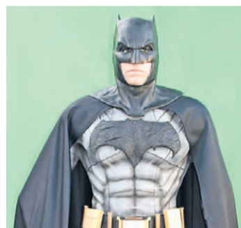
Il était possible de se faire photographe en compagnie de Batman lui-même!

Pour ma part, j'ai assisté le samedi, par une belle soirée estivale, à la projection de «Lego Bat-