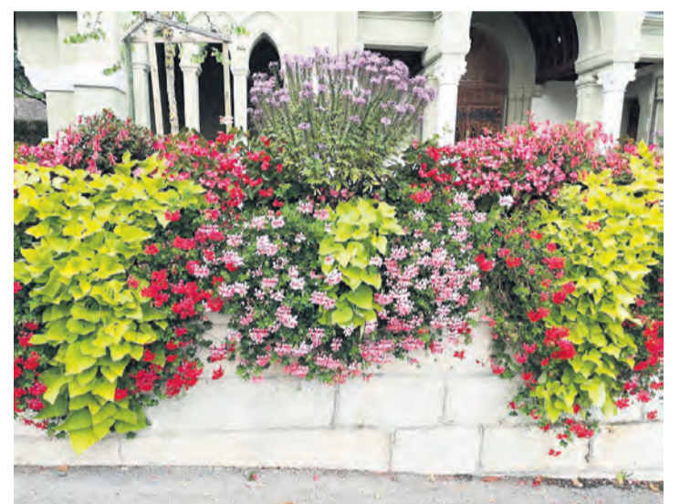
Le massif de fleurs se trouvant devant l'église. TARA KERPELMAN PUIG

À Genthod, on peut compter au moins 15 variétés de fleurs, toutes issues de producteurs de notre canton, comme les bégonias, cléomes, fuchsias, ipomées, certaines se trouvant dans une des centaines de bacs à fleurs que compte la commune.