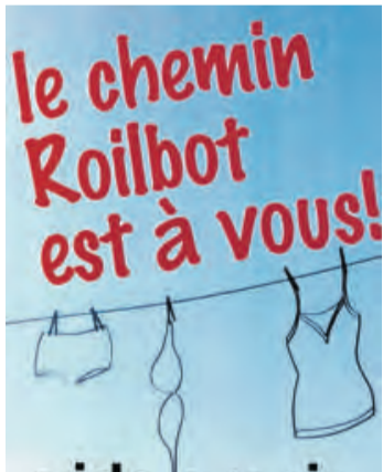
Détail de l'affiche.