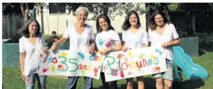
Les professionnelles du jardin d'enfants. LA MAIRIE

Des animations sont venues agrémenter cet anniversaire. En effet, les enfants ont assisté à un