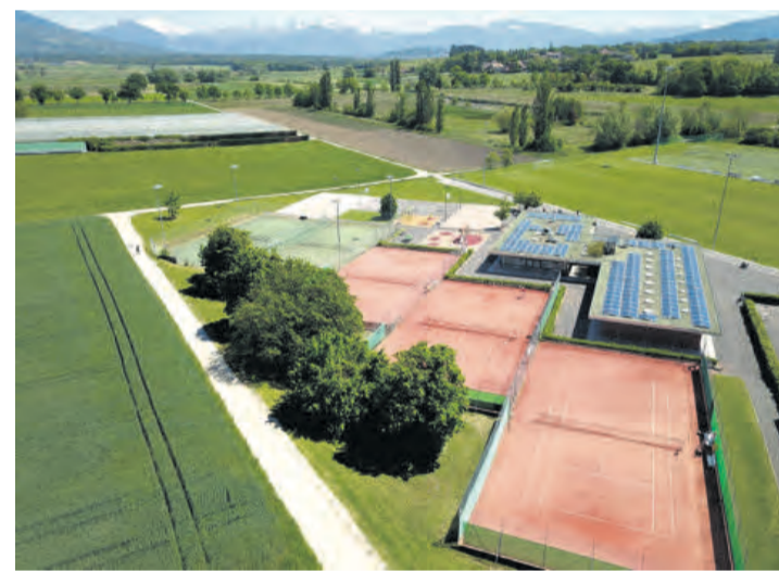
Le centre sportif de Rouelbeau sera le théâtre des festivités du 1 er septembre prochain. EMILIE NASEL

Venez donc nombreux fêter les 20 ans du Tennis Club de Meinier lors de cette journée qui se doit d'être ensoleillée - à savoir qu'en cas de pluie l'événement sera annulé. Plus d'infos sur tmeinier.ch