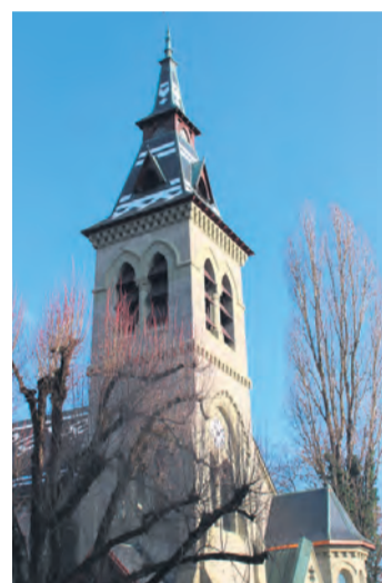
Le temple s'est fait tout beau. JEAN-PIERRE ABEL

Ces festivités sont organisées avec le précieux concours de la Mairie de Genthod, que le Conseil de paroisse tient à remercier très chaleureusement pour son aide. Venez nombreux, que la fête soit belle!