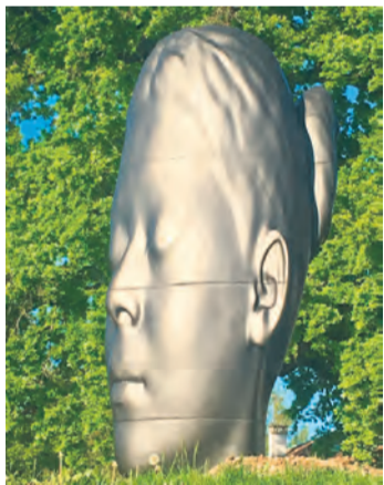
La sculpture de Jaume Plensa, haute de 4,50 m.