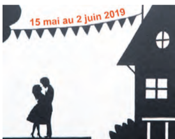
Détails d'une œuvre. DR

Du 18 mai au 2 juin, Lanfranco Corsi expose ses peintures sur toile sous le titre «En scène» à la Galerie le clin d'œil. Vernissage le 15 mai dès 18 h.