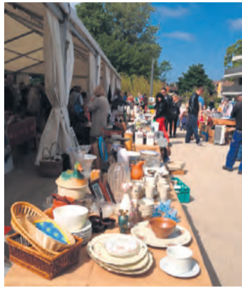
L'année dernière, l'événement a remporté un franc succès.

Cette année encore, pour sa 6 e édition - qui se tiendra comme à son habitude sur l'esplanade de