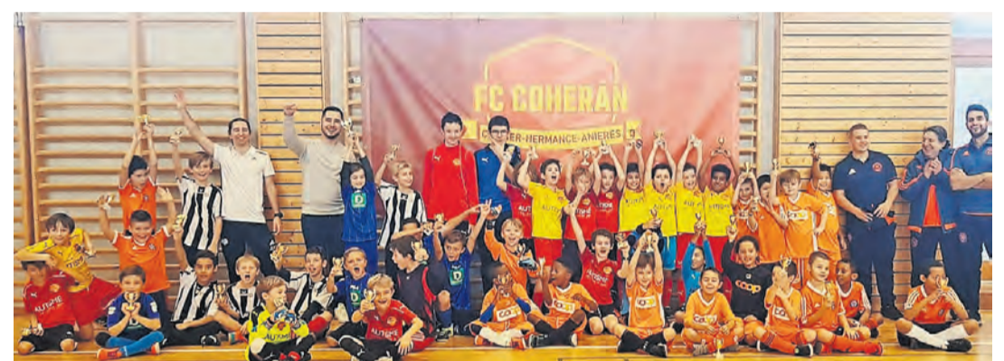
De joyeux et enthousiastes petits vainqueurs. FC COHERAN