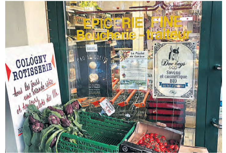
L'épicerie fine de Cologny et sa devanture colorée.