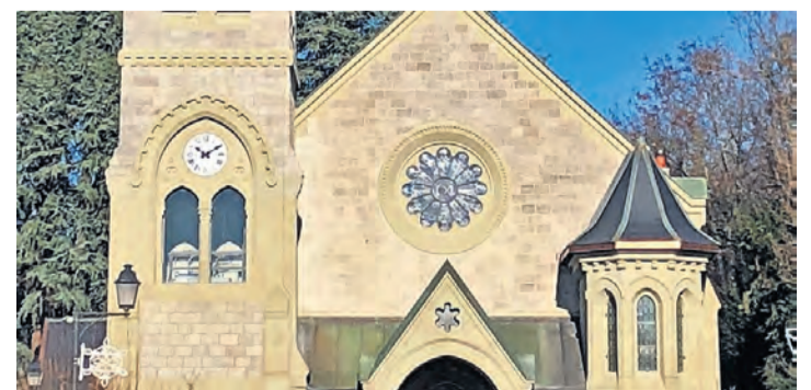
Le temple de Genthod et son cadran. SANDRA WIDMER JOLY

En effet, si nous restons à cet horaire, c'est spécifiquement «voulu». Car si vous regardez bien les aiguilles, dix heures dix ressemblent à un sourire. Et il faut savoir que le temple de Genthod ne fait que se mettre au goût du