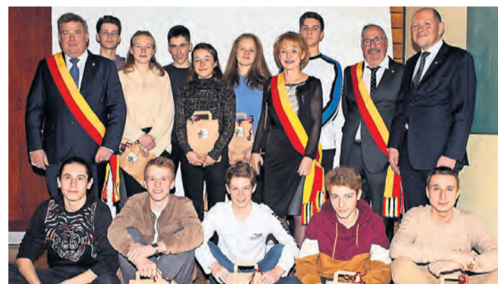
Les jeunes Corsiéris atteignant leur majorité en 2019, entourés des autorités communales.