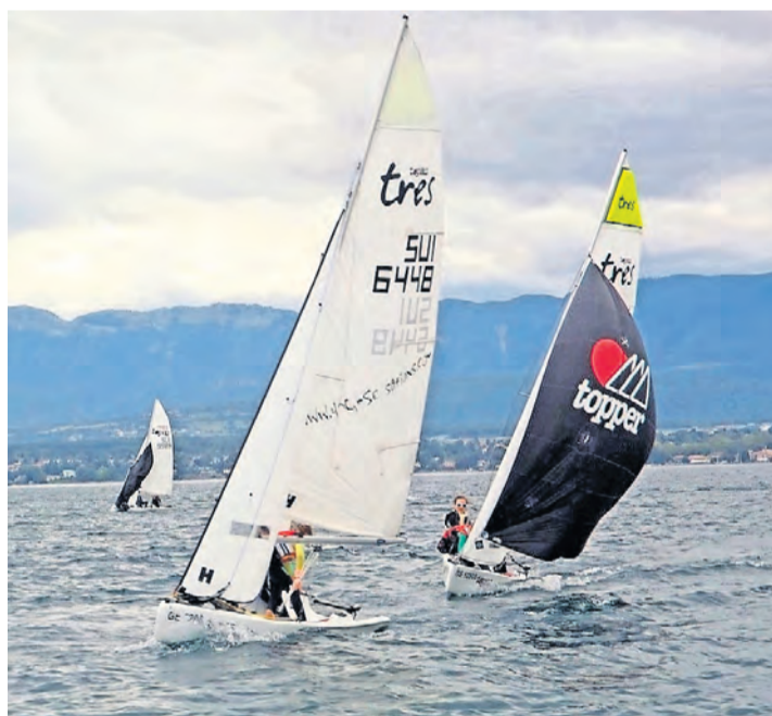
Des Topaz - dériveurs - cours donnés aux enfants dès 11/12 ans jusqu'à 18 ans. ÉCOLE DE VOILE

L'ancienne guérite de la CGN, au débarcadère, fait office de port d'attache et chaque semaine, après les cours, a lieu un pique-nique où chacun amène ses grillades, pour un vrai moment de partage entre les membres, les pa-