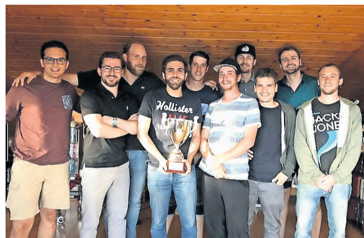
Des joueurs de l'Association de Basket d'Anières. CLUB DE BASKET