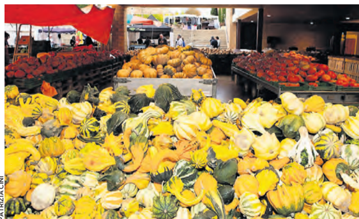
Quelques étalages de cucurbitacées à la Fête de la Courge.

De magnifiques stands d'artisanat où l'on pouvait admirer le savoir-faire de quelques artisans venus du Valais ou de France voisine apportaient une touche culturelle à cette journée. Un régal pour les yeux mais aussi pour le palais, puisqu'on a pu déguster la reine de la fête en soupe, beignet, tarte, cake et, pour nourrir les estomacs les plus exigeants, de la raclette,