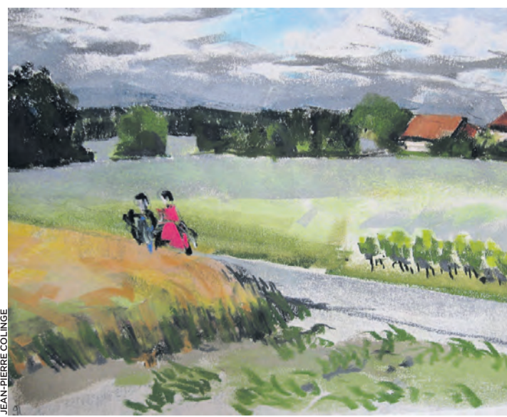
Détail d'un tableau au pastel sec exposé à la galerie d'Anières.

Vous pouvez venir admirer ses œuvres aux horaires suivants: jeudis et vendredis de 17 h à 20 h, samedis et dimanches de 12 h à 18 h. Vernissage le mercredi 28 novembre. Pour l'heure, se renseigner sur le site www.anieres.ch/galerie-anieres/ Morgan Fluckiger